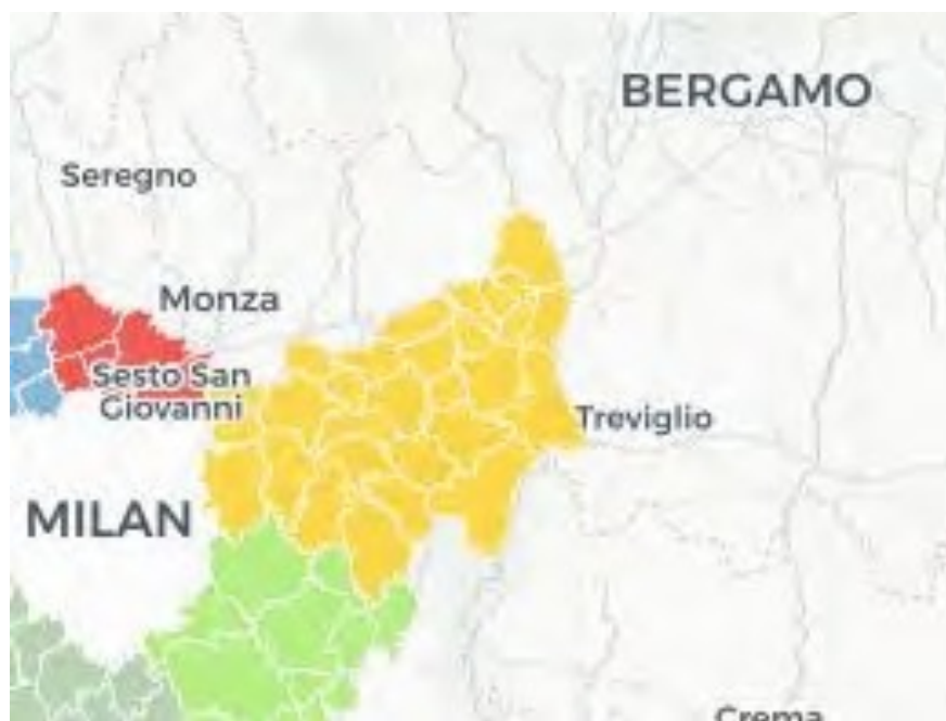
Immagine 1 – Zona omogenea Adda Martesana (in giallo)